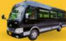
BUS (10-18 ท่าน)