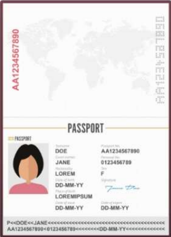
รูปถ่ายหน้าพาสปอร์ต