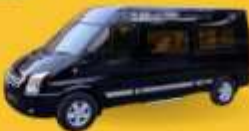
VAN (7-8 ท่าน)