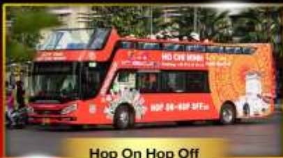
Hop On Hop Off