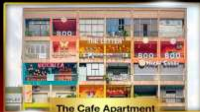
The Cafe Apartment