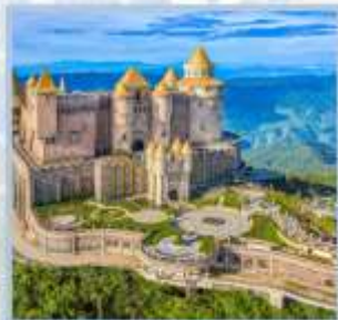
ปราสาทจันทร