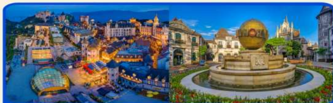
พักผ่อน บานาฮิลล์ 1 คืน