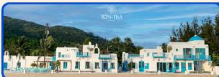
เช็คอินคาเฟ่ SON TRA MARINA