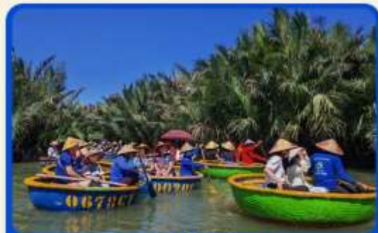
พิเศษ !!! นั่งเรือกระดัง UNSEEN เวียดนาม