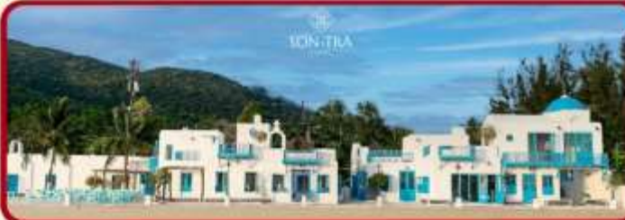
เซ็คอินคาฟ SON TRA MARINA