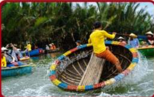
พิเศษ !!! นั่งเรือกระดัง UNSEEN เวียดนาม