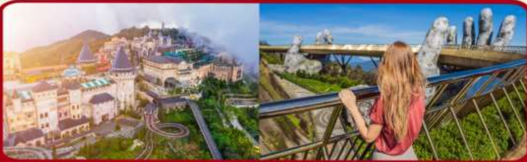
เที่ยวบานาฮิลล์เต็มวัน แบบจุใจ