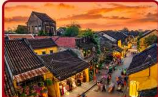
เที่ยวเมืองเก่าฮอยอัน