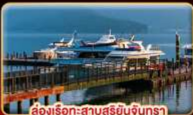
ส่งเรือทะเลสาบสุริยบินจินกรา

"นั่งรถไฟชมอุทยานอาลีซาน" ปล่อยคอมลอยเส้นทางรถไฟผิงซี