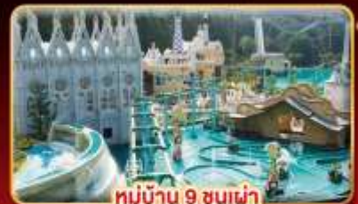
หมู่บ้าน 9 ชนเผ่า