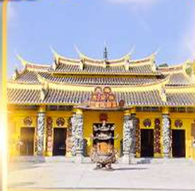
วัดซอพรเทพเจ้า