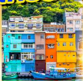
หมู่บ้านประมงเจินปิง

พักชิเหมินตง 2 คืน เที่ยวเต็ม!! ไม่มีวันอิสระ