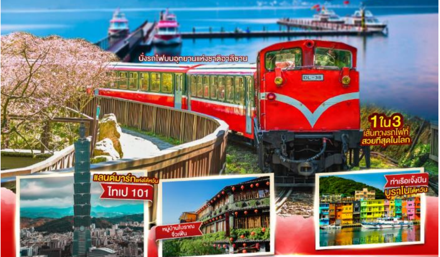
นั่งรถไฟบนอุทยานแห่งชาติอาลีซาน

ประกันการเดินทางอุบัติเหตุ คุ้มครองสูงสุด 3,000,000 ขอสงวนสิทธิ์ตามเงื่อนไข