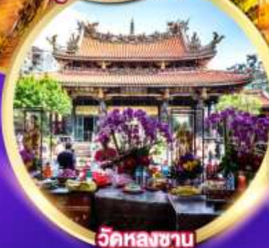
วัดหลงซาน