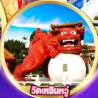
วัดเหวินหู่