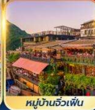
หมู่บ้านจิวเฟิ่น