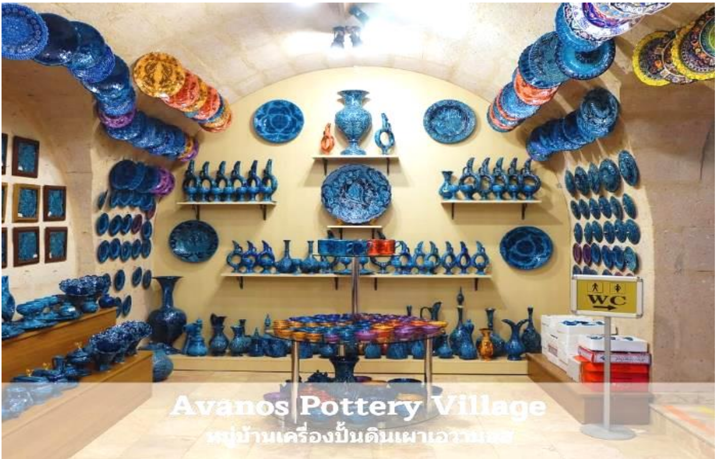
Avanos Pottery Village หมู่บ้านเครื่องปั้นดินเผาเอวานอส

ค่า รับประทานอาหารค่ำ ที่พัก MUSTAFA HOTEL หรือเทียบเท่า