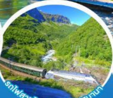
รถไฟขบวนโรแมนติกฟลินสบานา