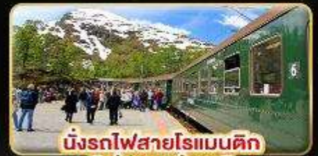
นั่งรถไฟสายโรเมนติก "พร้อมสะพาน"