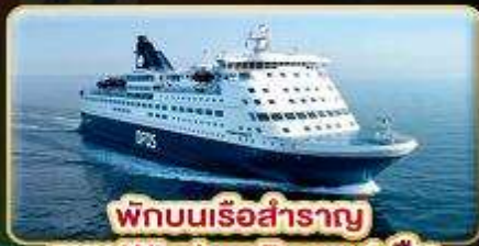
พักผ่อนเรือสำราญ แบบ Window Room 1 คืน