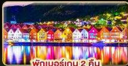
พักเบอร์เกน 2 คืน