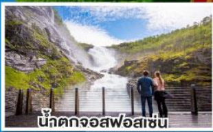
น้ำตกจอสฟอสเซ่น