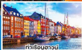
ท่าเรือบูธาว์น