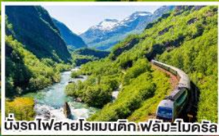
นั่งรถไฟสายโรแมนติกฟลัมส์โบตรีล