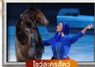
โชว์ละครสัตว์