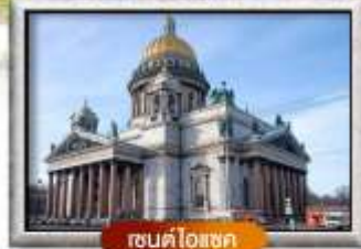
เซนต์ไอแซค