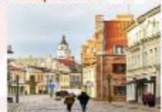
Kaunas Old Town

** พักที่ Holiday Inn Vilnius Hotel 4* หรือเทียบเท่า **