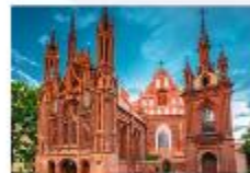
โบสถ์เซนต์แอน