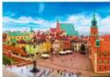
จัตุรัสเมืองเก่า