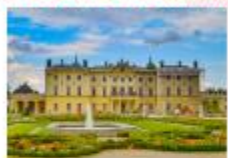
พระราชวัง Branicki