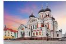
โบสถ์อเล็กซานเดอร์ เนฟสกี

19.35 น. ออกเดินทางสู่อิสตันบูล เที่ยวบิน TK1424