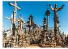
Hill of Crosses