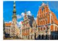
เมืองริกา

** พักที่ Bellevue Park Hotel Riga 4* หรือเทียบเท่า **