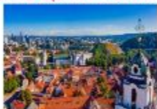
Vilnius Old Town