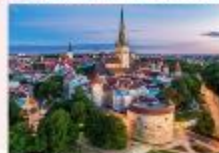
Tallinn Old Town