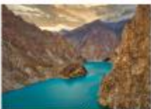
ทะเลสาบอิตตาบัด

** พักที่ Sarai Silk Route Hotel หรือเทียบเท่า **