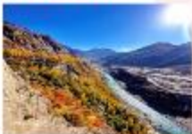
บ้อมปราการ Altit Fort

DAY4 บ้อมปราการอัลติท-ตลาดพื้นเมือง-ฮอปเปอร์ กลาเซียร์-หุบเขาคุยเกอร์