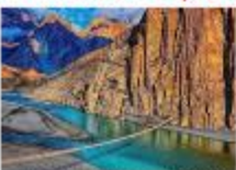
สะพานแขวนฮุสไซนี

DAY6 สะพานแขวนฮุสไซนี-กิลกิต-พระพุทธรูปคาร์กาห์