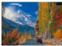
เมืองชิลาส

** พักที่ Shangrila Chilas Hotel หรือเทียบเท่า **