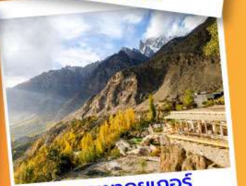
ยอดเขาตุยเกอร์