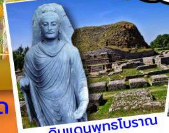
ดินแดนพุทธโบราณ ตักศิลา