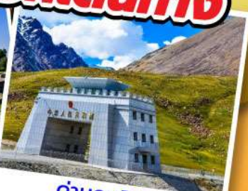
ด่านคุนจิราบ