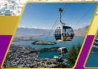
นั่งกระเช้ากอนโดล่า รับประทานอาหาร บนยอดเขานิวฟันพีค