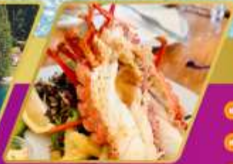
คั่งมั่งกรทำนละครึ่งตัว