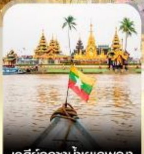
เจดีย์กลางน้ำเยเลพญา