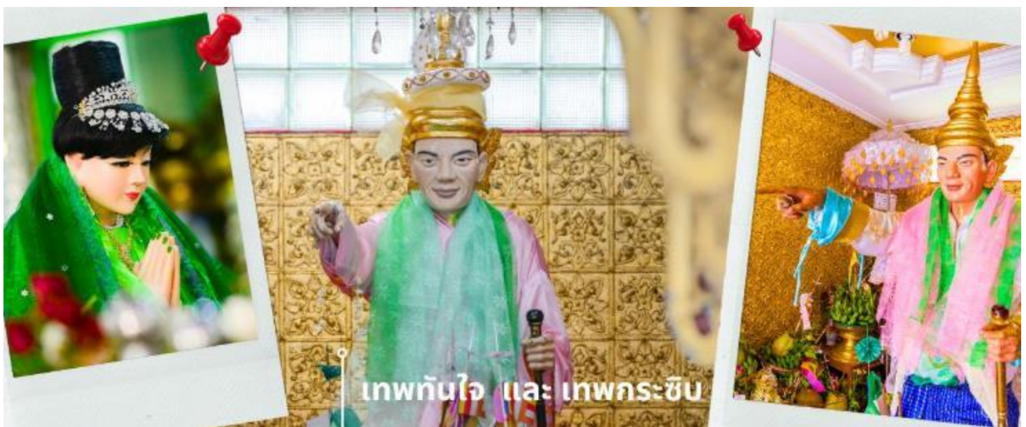
เทพทันใจ และ เทพกระซิบ

เจดีย์โบตาทาว (Botahtaung Pagoda) หมายถึง ทหาร 1,000 นาย เมื่อในอดีตพระเจ้าโองกะลาปะกษัตริย์มอญ ได้ให้ทหาร 1,000 นาย ตั้งแถวถวายความเคารพพระเกศาธาตุ บรรจุไว้ 1 เส้น ในเจดีย์นี้ ที่อันเชิญมาจากอินเดีย ไฮไลต์ที่สำคัญที่นักท่องเที่ยวนิยมมาสถานที่แห่งนี้คือ การมาสักการะบูชา เทพทันใจ หรือ นัตโบโบยี และยังมี เทพกระซิบ ภายในเจดีย์เป็นที่เก็บผอบหินทรงสลับพบสมบัติล้ำค่าหลายชนิดเช่น อัญมณี, เครื่องประดับ, เพชรพลอย, จาริกดินเผา, และพระพุทธรูปทองคำ, เงิน, ทองเหลือง, หิน พระพุทธรูปจำนวนทั้งหมดภายในและภายนอกผอบราวกว่า 700 องค์ จาริกดินเผาบางส่วนเป็นเรื่องราวของคำสอนและเรื่องราวทางพุทธศาสนา ขอนัตโบโบยี หรือ คนไทยรู้จักกันในชื่อว่า เทพทันใจ เป็นคำเรียกเทพเจ้าในตำนานที่เป็นเทพารักษ์ประจำวัดหรือพระเจดีย์ในศาสนาพุทธแบบพม่า โดยทั่วไปนิยมสร้างรูปเคารพโป้โง้เป็นรูปเคารพชายสูงวัยขนาดเท่าบุคคล สวมเครื่องประดับศิระชะ บางครั้งถือไม้เท้าเพื่อย้ำถึงความอาวุโส เทพทันใจแห่งนี้ เป็นสถานที่ที่คนไทยให้ความนับถือเป็นอย่างมาก เชื่อกันว่าการได้มาขอพรกับ นัตโบโบยี จะสัมฤทธิ์ผลทุกประการ จนเป็นที่กล่าวถึงและเล่าขานสืบกันมาช้านาน โดยใกล้กันยังมี เทพกระซิบ ซึ่งมีนามว่า “อะมาดอว์เมี้ยะ” ตามตำนานกล่าวว่า นางเป็นธิดาของพญานาค ที่เกิดศรัทธาในพุทธศาสนาอย่างแรงกล้า รักษาศีลไม่ยอมกินเนื้อสัตว์จนเมื่อสิ้นชีวิตไปกลายเป็นนัต ซึ่งชาวพม่าเคารพกราบไหว้กันมานานแล้ว การขอพรเทพกระซิบต้องเข้าไปกระซิบเบาๆ ห้ามคนอื่นได้ยิน การบูชาเทพกระซิบ บูชาด้วยน้ำนม ข้าวตอก ดอกไม้ และผลไม้