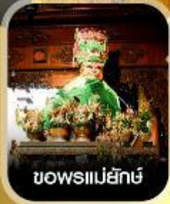
ขอพรแม่ย่าก๊

คอนเฟิร์มออกเดินทาง ทุกพีเรียด 2 ท่านขึ้นไป