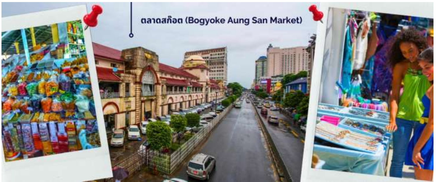
ตลาดสก๊อต (Bogyoke Aung San Market)

จากนั้นนำท่านนมัสการ พระมหาเจดีย์ชเวดากอง เจดีย์ทองแห่งเมืองดากอง หรือ ตะเกิง (ชื่อเดิมของเมืองย่างกุ้ง) แห่งลุ่มน้ำอิระวดี เจดีย์ทองคำคู่บ้านคู่เมืองประเทศพม่าอายุกว่าสองพันห้าร้อยกว่าปี มหาเจดีย์ที่ใหญ่ที่สุดของประเทศพม่า มีความสูงถึง 326 ฟุต สร้างโดยพระเจ้าโองกะลาปะ เมื่อกว่า 2,000 ปีก่อน มหาเจดีย์ชเวดากองมีทองคำโอบหุ้มอยู่เป็นน้ำหนักถึง 1100 กิโลกรัม ยอดฉัตรประดับประดาด้วยเพชรพลอยอัญมณีล้ำค่า กว่า 5,548 เม็ด รวมถึงทับทิม ขนาดเท่าไข่ไก่บนยอดองค์พระเจดีย์ชเวดากองเป็นลานกว้างรองรับแรงศรัทธาของ พุทธศาสนิกชนได้จำนวนมาก บริเวณทางขึ้นทั้งสี่ทิศจะมีวิหารโถงสร้างด้วยเครื่องไม้หลังคาทรงปราสาทปิดทองล่องชาดประดับกระจกทั้งหลัง ภายในประดิษฐานพระประธานสำหรับให้ประชาชนมากราบไหว้บูชา เพราะชาวมอญและชาวพม่าถือการกราบไหว้บูชาเจดีย์ชเวดากองเป็นนิตย จะนำมาซึ่งบุญกุศลอันเป็นหนทางสู่การหลุดพ้นทุกข์โศกโรคร้ายทั้งมวล บ้าง