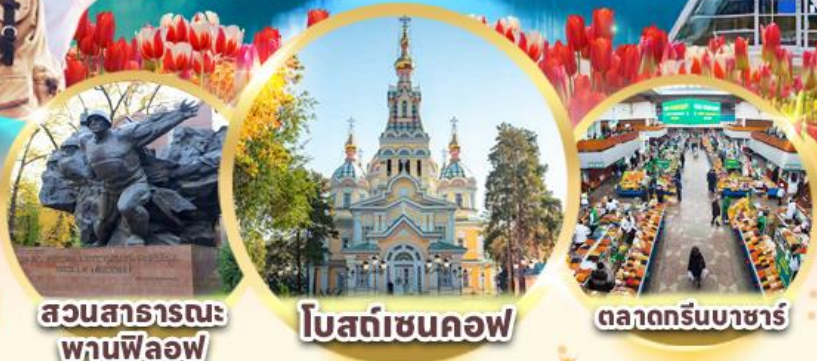
สวนสาธารณะพานฟิออฟ