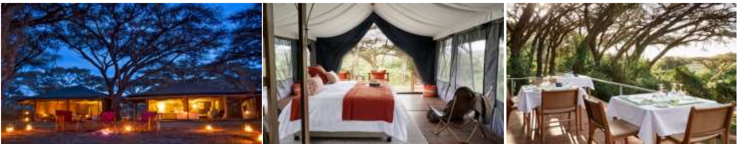
พักรับประทานอาหารค่ำ ณ ห้องอาหารของที่พักรับประทานอาหารค่ำ พักรับประทานอาหารค่ำ ณ ห้องอาหารของที่พักรับประทานอาหารค่ำ หรือเทียบเท่า (คืนที่2)