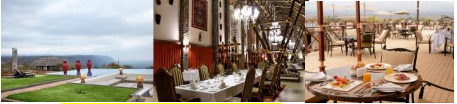
พักรับประทานอาหารค่ำ ณ ห้องอาหารของที่พักรับประทานอาหารค่ำ พักรับประทานอาหารค่ำ ณ ห้องอาหารของที่พักรับประทานอาหารค่ำ หรือเทียบเท่า (คืนที่1)