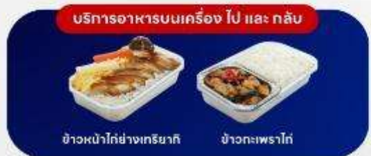
บริการอาหารบนเครื่อง ไป และ กลับ