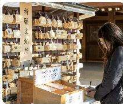
ศาลเจ้าเมจิจิงกู

ศาลเจ้าเมจิ หนึ่งในสถานที่อันศักดิ์สิทธิ์ใจกลางกรุงโตเกียว สิ่งแรกที่จะทำให้คุณประทับใจคือการเดินผ่านเสาโทริอิขนาดใหญ่ ระหว่างทางมีธรรมชาติที่ทำให้รู้สึกเหมือนก้าวเข้าสู่อีกโลกหนึ่ง ที่เต็มไปด้วยความสงบ อีกทั้งยังสามารถเขียนคำอธิษฐานลงบนแผ่นไม้ "เอมะ" เพื่อขอพรสำหรับความสุขและความสำเร็จในชีวิตอีกด้วย จากนั้นนำพาทุกท่าน... ซุปปิงกันต่อใจกลางกรุงโตเกียว เมืองที่เป็นศูนย์กลางของแฟชั่นและนวัตกรรม และเปิดประสบการณ์การช้อปปิ้งที่ไม่เหมือนใคร! สักรวดย่านต่าง ๆ ที่แต่ละแห่งที่มีเสน่ห์และเอกลักษณ์อันโดดเด่น เมืองที่เต็มไปด้วยชีวิตชีวาและความทันสมัยที่หลากหลายอย่าง ย่านฮาราจุกุ แหล่งรวมแฟชั่นที่แปลกใหม่และสดใส เดินเล่นบน Takeshita Street ที่เต็มไปด้วยเสื้อผ้าและเครื่องประดับที่ไม่ซ้ำใคร เพลิดเพลินกับบรรยากาศสุดคูลที่เป็นเอกลักษณ์