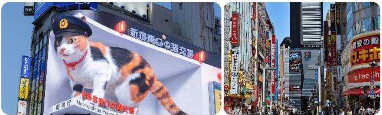
ช้อปปิ้งใจกลางกรุงโตเกียว - ซินจูกุ

มือกลางวัน บริการท่านด้วย ชุดอาหารญี่ปุ่นเบนโตะ