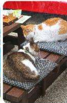
เกาะเอโนะชิมะ

เมืองคามาคุระ (Kamakura) เมืองน่ารักติดทะเล ตบโจทย์ที่เที่ยวที่ผสมผสานระหว่างประวัติศาสตร์ ธรรมชาติ และความงามของทะเล บอกเลยใครมาต้องตกหลุมรักกับเมืองสุดชิล อย่าง คามาคุระ เมืองเล็กๆ ที่ตั้งอยู่ทางตอนใต้ของจังหวัดคานากาวะ ห่างจากโตเกียวเพียงแค 1 ชั่วโมง เท่านั้น แต่เต็มไปด้วยสถานที่ท่องเที่ยว ทิวทัศน์ธรรมชาติ และชายหาดที่งดงาม ที่นี้จะทำให้ทุกคนรู้สึกเหมือนได้ย้อนกลับไปสัมผัสประวัติศาสตร์ญี่ปุ่นในยุคซามูไร พร้อมทั้งได้ผ่อนคลายท่ามกลางบรรยากาศที่เงียบสงบและสดชื่น