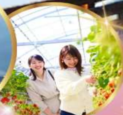
บุฟเฟต์ สดอเบอร์รี่ เก็บสดจากต้น