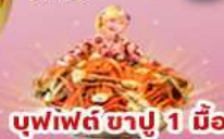
บุฟเฟต์ ซาปู 1 มื้อ