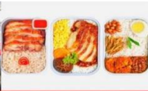
บริการอาหารร้อน ทั้งขาไป-ขากลับ