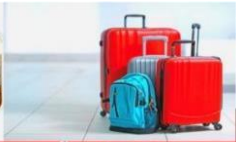
น้ำหนักกระเป๋า สูงสุด 20 กก.

มาร์คของโตเกียวเป็นหอคอยส่งสัญญาณโทรทัศน์ที่เป็นสิ่งปลูกสร้างที่สูงที่สุดในญี่ปุ่นและเป็นหอคอยที่สูงที่สุดในโลกตั้งอยู่ที่เขตสุมิตะหน้าที่หลักของโตเกียวสกายทรีคือการกระจายสัญญาณสื่อสารแบบดิจิตอลนั่นเอง และโตเกียวสกายทรียังแทรกความเป็นมาของท้องถิ่นเอาไว้ด้วยความสูงของหอคอยที่ 634 เมตร มาจาก มุซาชิคุนิชื่อเรียกในอดีตของแถบนี้ซึ่งตัวเลข 634 สามารถอ่านตามเสียงตัวเลขเป็นมุซาชิได้