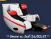
**อัพเดท ณ วันที่ 26/02/67**

Premium Flatbed ที่นั่งสุดพิเศษขนาด 19 นิ้ว กว้างและยาวกว่า 99 นิ้ว สามารถปรับนอนได้ทั้งแบบหงายหรือคว่ำ พร้อมด้วยอุปกรณ์อำนวยความสะดวกสบายครบถ้วน