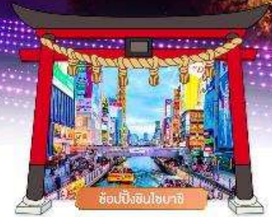
ช้อปปิ้งชินไซบาชิ

เดินทางโดยสายการบิน : ไทยแอร์เอเชียเอ็กซ์