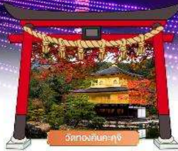
วัดทองคินคะคุจิ