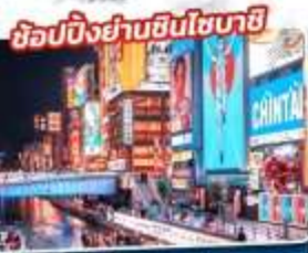
ชึอปบึงย่านฮึนซึบาสึ