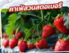
คาวะลวนสลตอเบอรึ