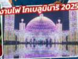
งานไฟ โทเบลลึบทรึ 2025

ลำนสทึ GRANSNOW OKUIBUKI - หมู่บ้านชึราคาวาทะ - พักร็องเรมจ็อกลำนนึมบะ