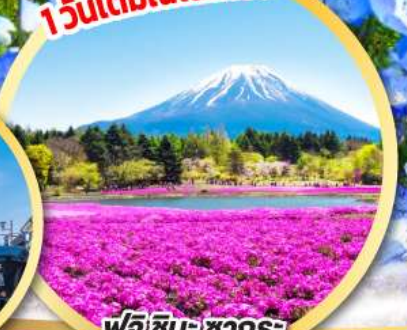
ฟูจิชิบะ ซากุระ เฟสตีวัล

ทัศนียภาพบนเนินเขามิฮาราชิ สวนอิตาชิ ซีไซด์ ปาร์ค ฟูจิชิบะ ซากุระ เฟสตีวัล (Pinkmoss)