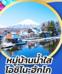
หมู่บ้านน้ำใส โอชิโนะอึกิโกะ