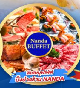
พิกะบุฟเฟ่ต์ บึงย่างร้าน NANDA

เดินทาง (วันปีใหม่ 2568) 27 ธ.ค.-01 ม.ค. 68 29 ธ.ค.-03 ม.ค. 68