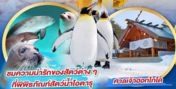
ชมความน่ารักของสัตว์ต่างๆ ที่พิพิธภัณฑ์สัตว์น้ำโอตารุ