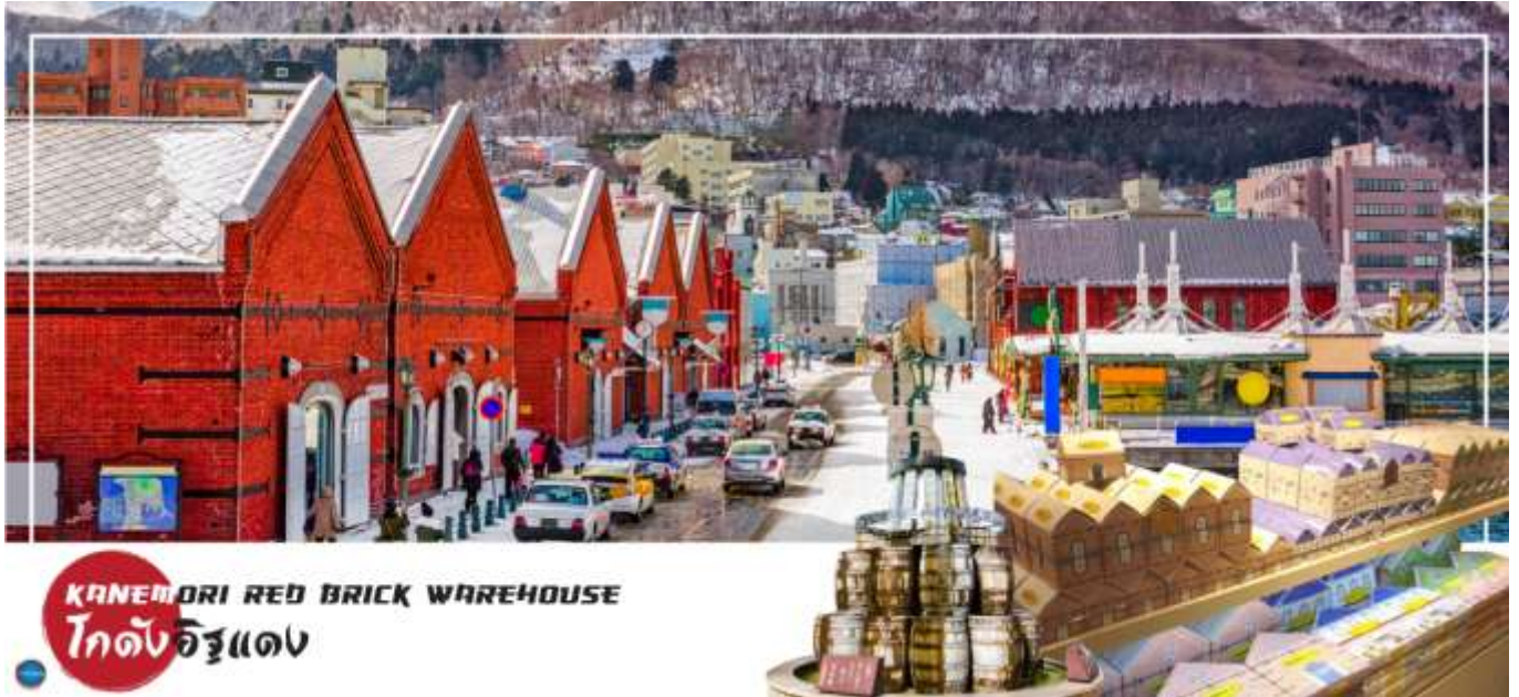
KANEMORI RED BRICK WAREHOUSE โกดังอิฐแดง