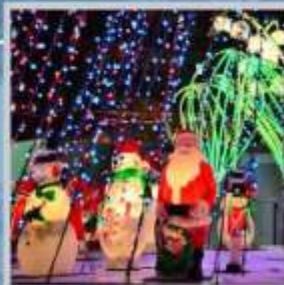
"ODORI GERMAN CHRISTMAS"