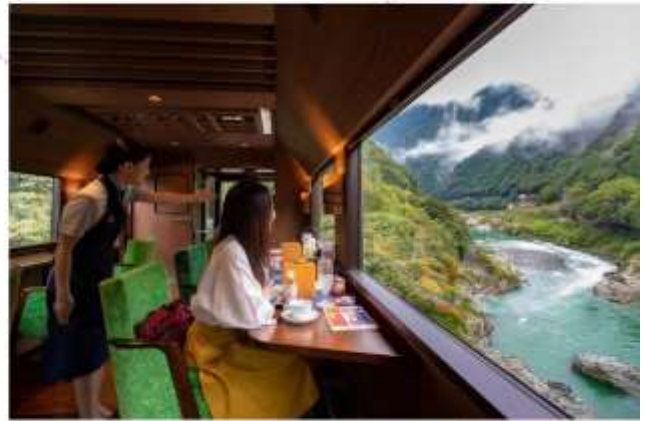
รับประทานอาหารกลางวัน ภายในรถไฟ (เมนูอาหารไม่สามารถเปลี่ยนได้)