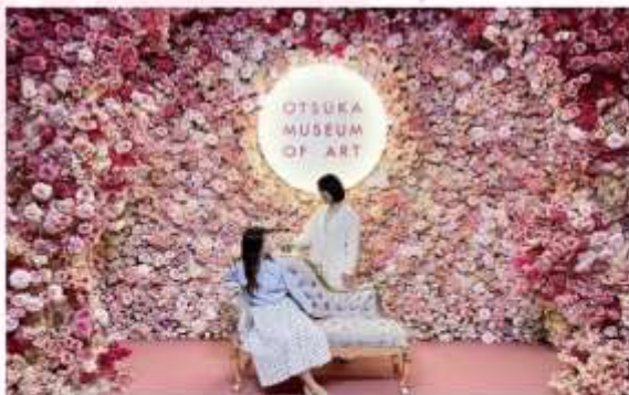
OTSUKA MUSEUM OF ART