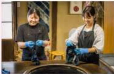
MAKE INDIGO DRING