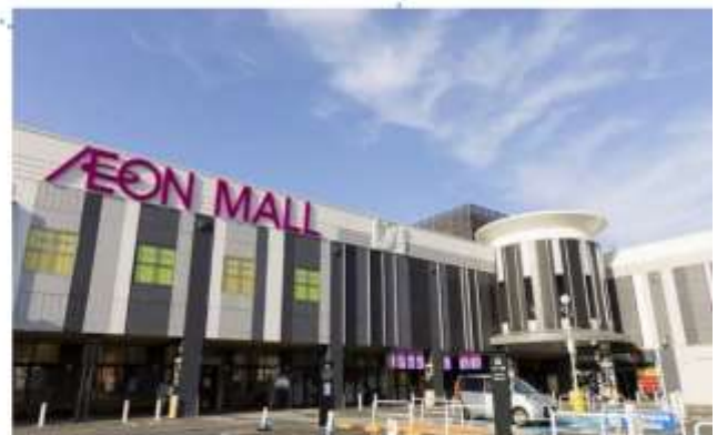
อีสระอาหารกลางวันตามอียออน (ไม่รวมในรายการ)