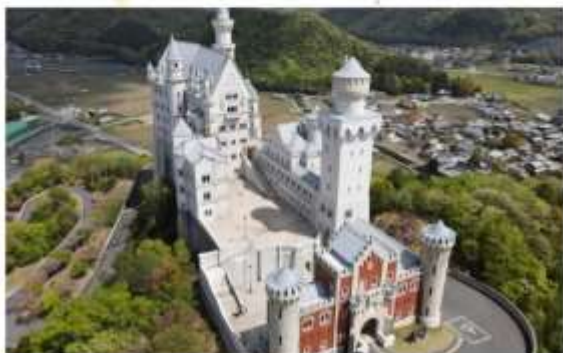
รูปภาพประกอบใช้เพื่อการโฆษณาเท่านั้น

รับประทานอาหารค่ำ ณ กิตตาคาร... อัพเกรด โคเชกัปปู ผสมผสานความสดใหม่ อร่อย และประณีต จากร้านอาหารชื่อดังที่โด่งดังเรื่องเมนูปู เบ็ดมาแลงกว่า 64 ปี