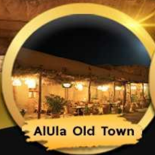
AlUla Old Town