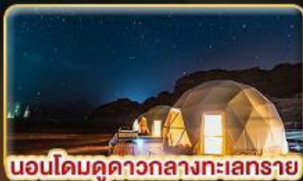
นอนโดมคูดาวกลางทะเลทราย

บินตรงสู่ “จอร์แดน” เยือน 7 มหัศจรรย์ของโลก