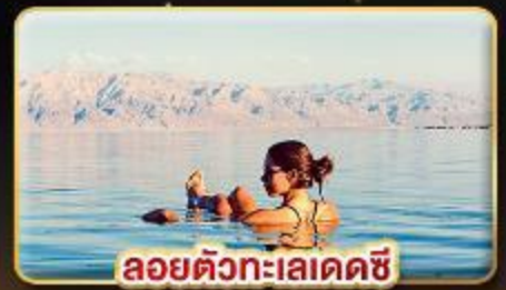
ลอยตัวทะเลเดดซี