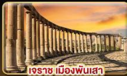
เอรราช เมืองพินเสา