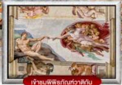
เข้าชมพิพิธภัณฑ์วาติกัน

เมนูพิเศษ! สปาเกตตีเส้นหมึกดำ, พิชซ่าสไตล์อิตาลีเย็นแท้