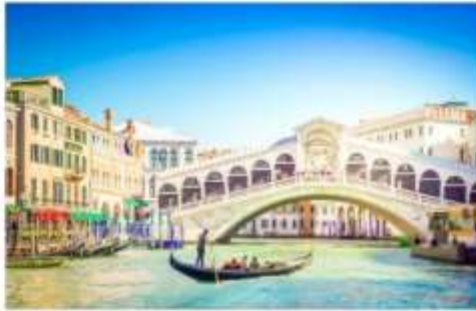
สะพานริอัลโต