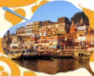
พาราณสี เมืองหลวงทางจิตวิญญาณอินเดีย