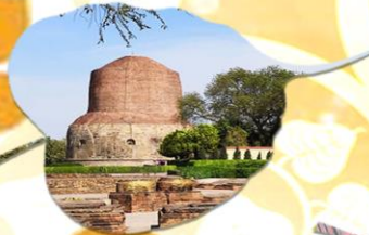
กุสินารา สถานที่ปรินิพพาน