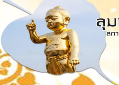
ลุมพินี สถานที่ประสูติ