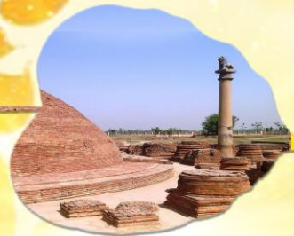
เมืองหลวงแคว้นอานาจักรวัชชี แคว้นชมพูทวีป