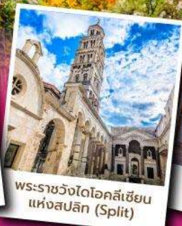
พระราชวังไดโอสคลีเซียน แห่งสปลิน (Split)