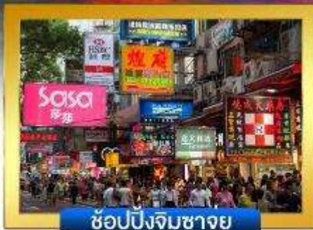
ช้อปปิ้งจิมซาจู้