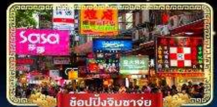
ช้อปปิ้งจิมซาจู้