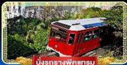
นั่งรถรางพิกเจอร์

นั่งกระเช้ามองปิง 360 องศา บินลัดฟ้าไปมู..สู่เกาะฮ่องกง