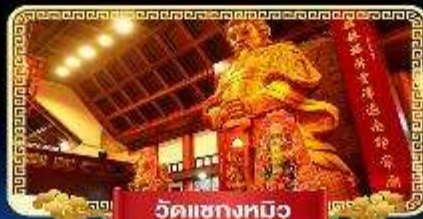
วัดเข่งหมิว