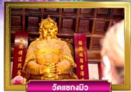
วัดแชกงมิ่ง