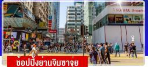
ช้อปปิ้งย่านจิมซาจอย