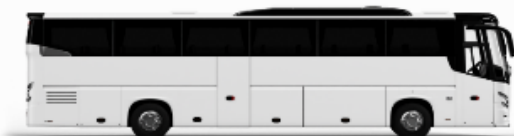
ตัวอย่างรูปภาพ 1 คัน

หากประเทศลี้ภัยที่ท่านริเคอสมาดำเนินการ เช่น ริเคอสหองพักเป็น TWIN BED หรือ DOUBLE BED ทางบริษัทขอสงวนสิทธิ์ในการปรับประเภทห้องพัก เป็นตามที่โรงแรมมีอยู่ โดยไม่ต้องแจ้งให้ทราบล่วงหน้า