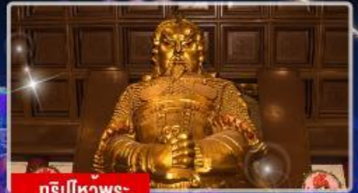
กริ๊ปไหวพระ