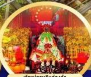
เจ้าแม่กวนอิมองค์อา นับถือองค์เจ้าแม่กวนอิมที่ี้อายุกว่า 600 ปี