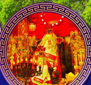
วัดเจ้าแม่กวนอิม ย่องฮ่า