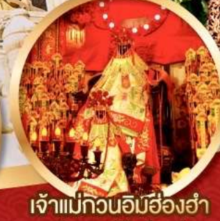
เจ้าแม่กวนอิมสี่องค์

นมัสการองค์เจ้าแม่กวนอิม อายุกว่า 600 ปี