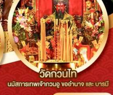
วัดกวนไท่

นมัสการองค์เจ้าแม่กวนอิม อายุกว่า 600 ปี